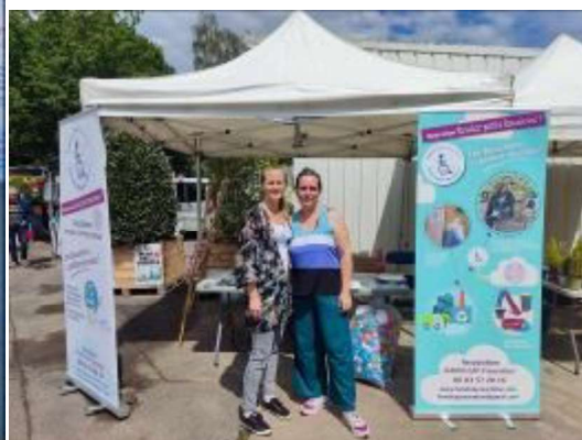
Hemeline et Florence. Merci à Konica Minolta pour les nouveaux Kakémons