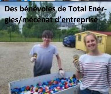
Des bénévoles de Total Energies/mécénat d'entreprise