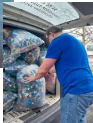
Tristan à Poissy et tant d'autres.

Sachez que quasiment tous les jours nos trieurs bénévoles viennent trier tous les sacs. Vraiment merci à eux ainsi qu'au mécénats de Compétence de Total Energie et des Laboratoires Servier .